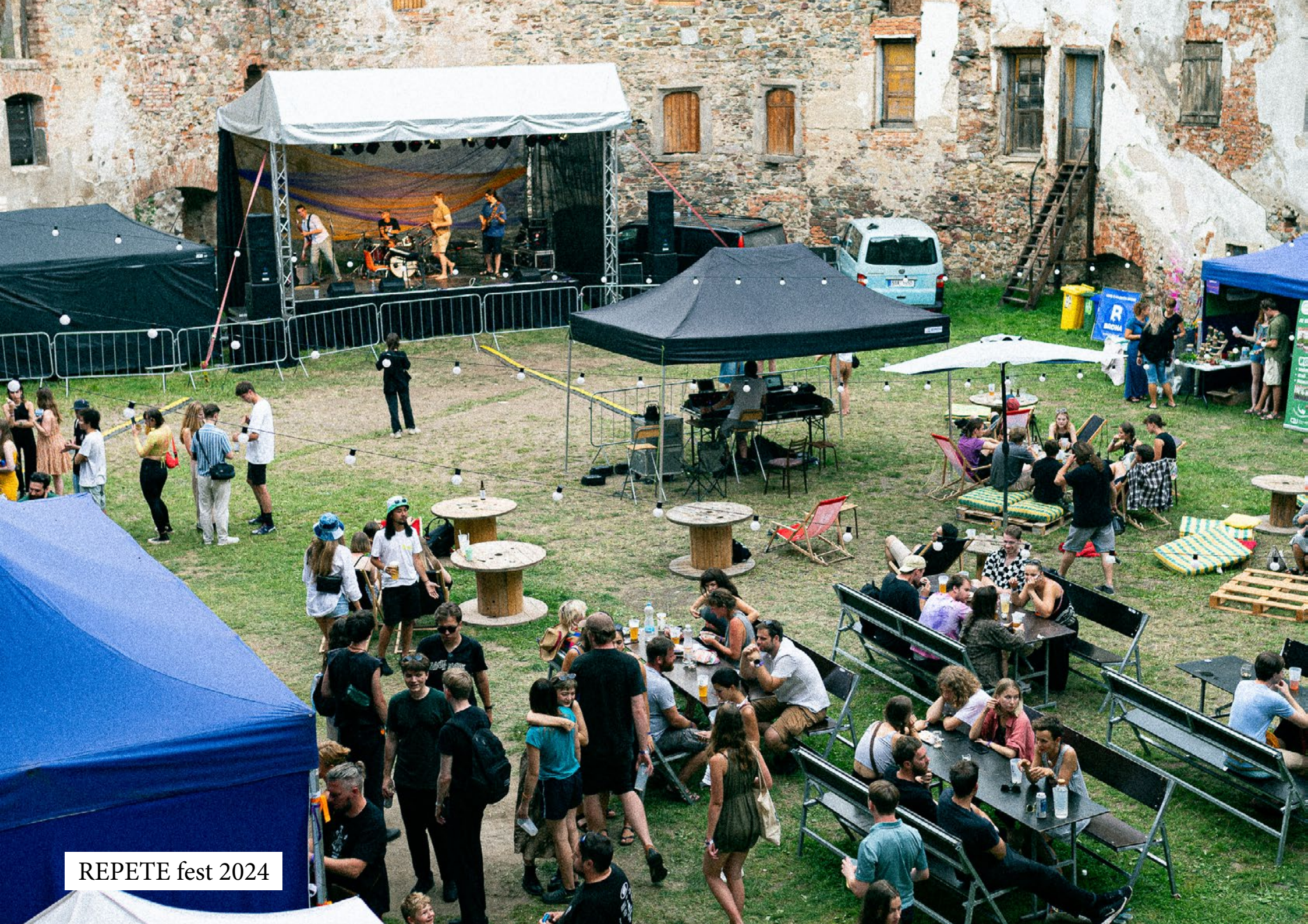
REPETE fest 2024