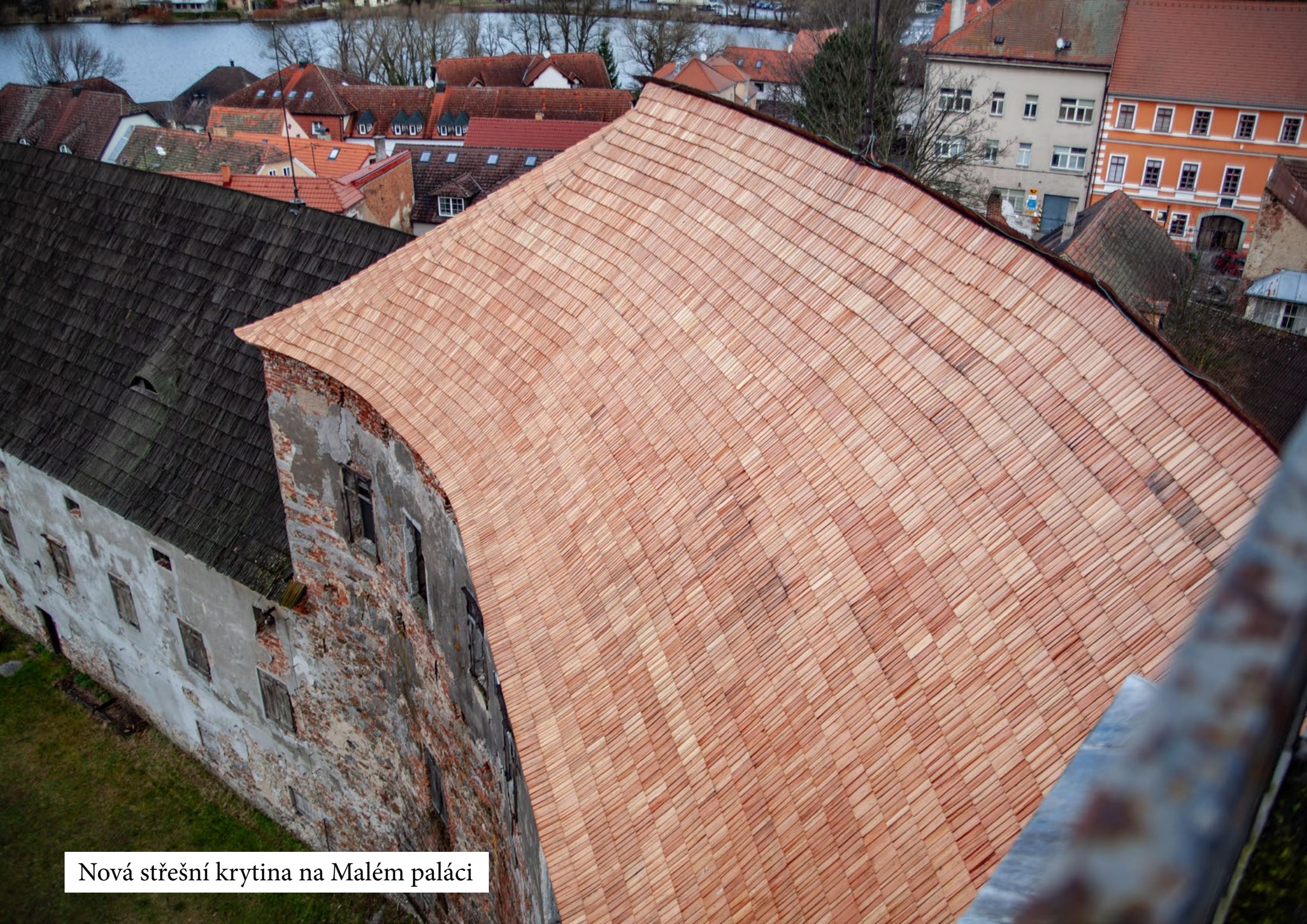
Nová střešní krytina na Malém paláci