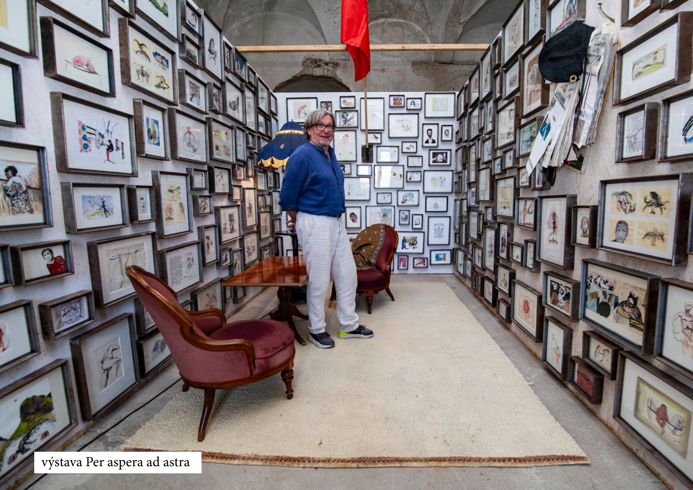
výstava Per aspera ad astra