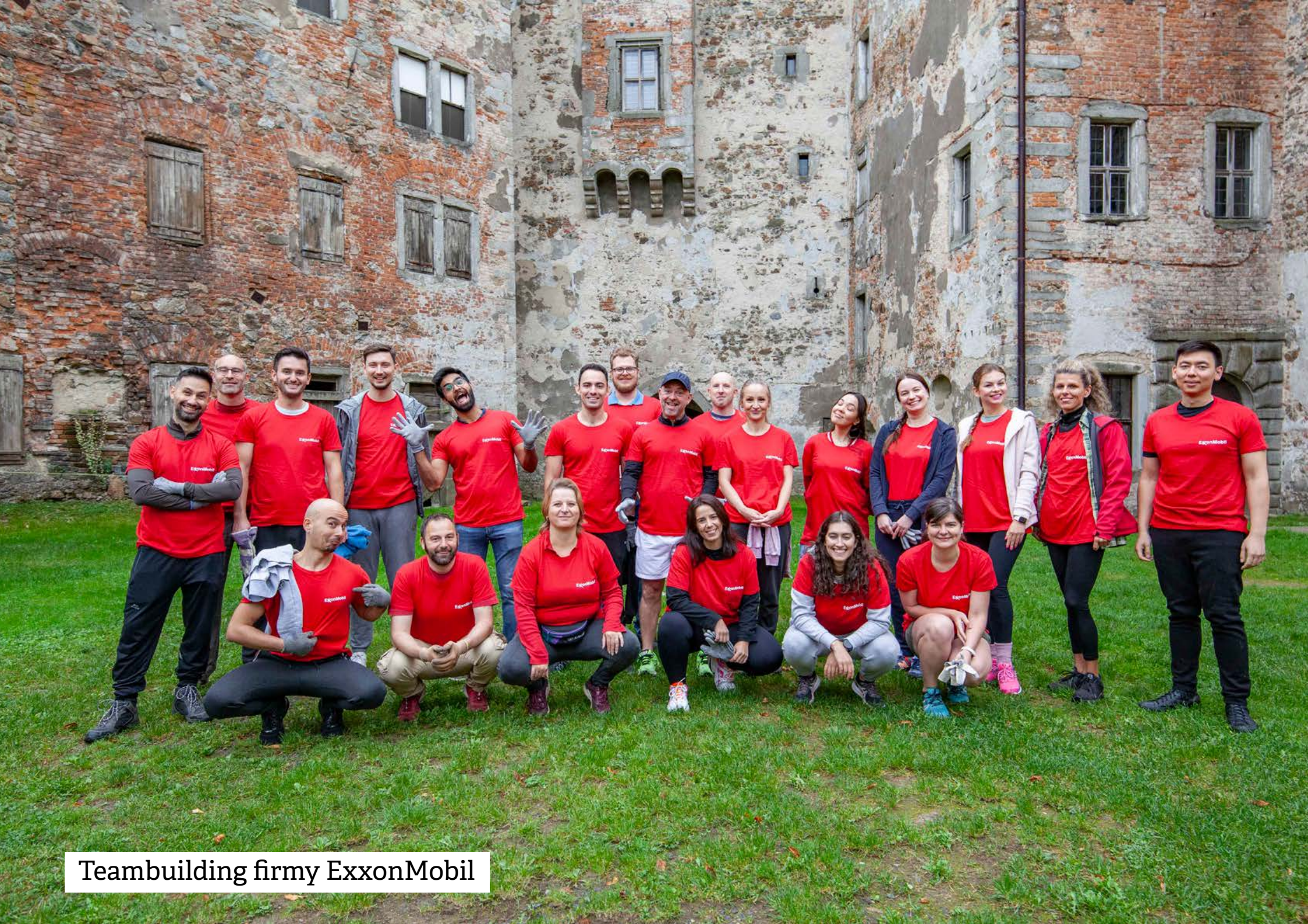
Teambuilding firmy ExxonMobil