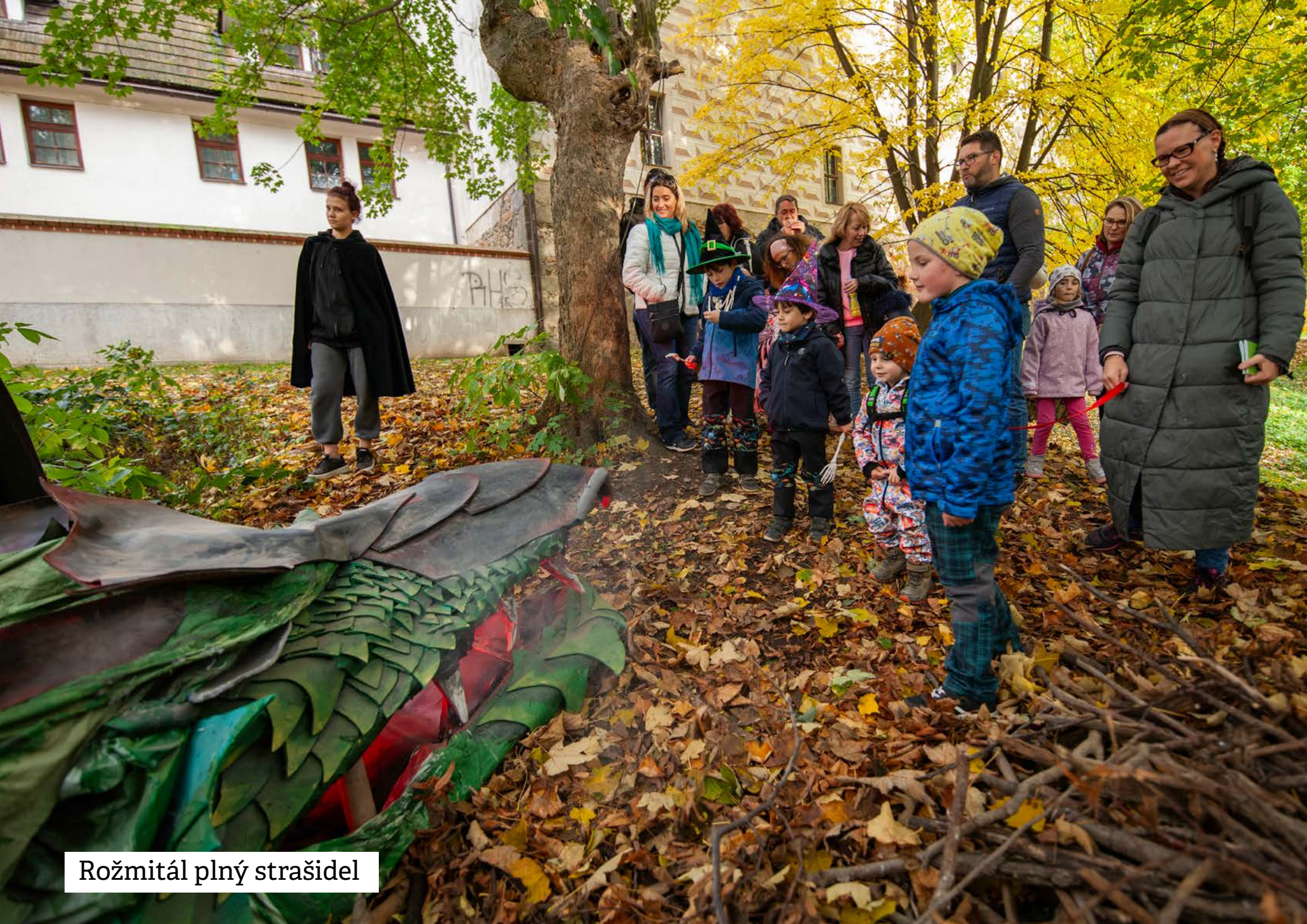
Rožmitál plný strašidel