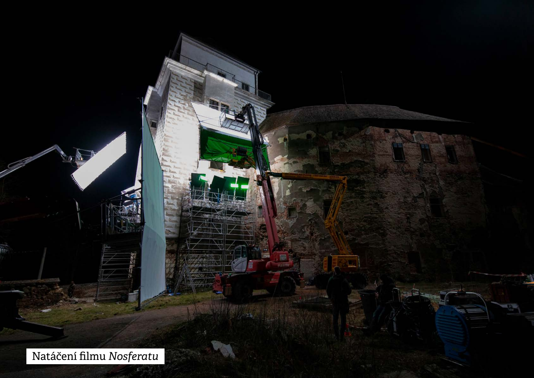
Natáčení filmu Nosferatu