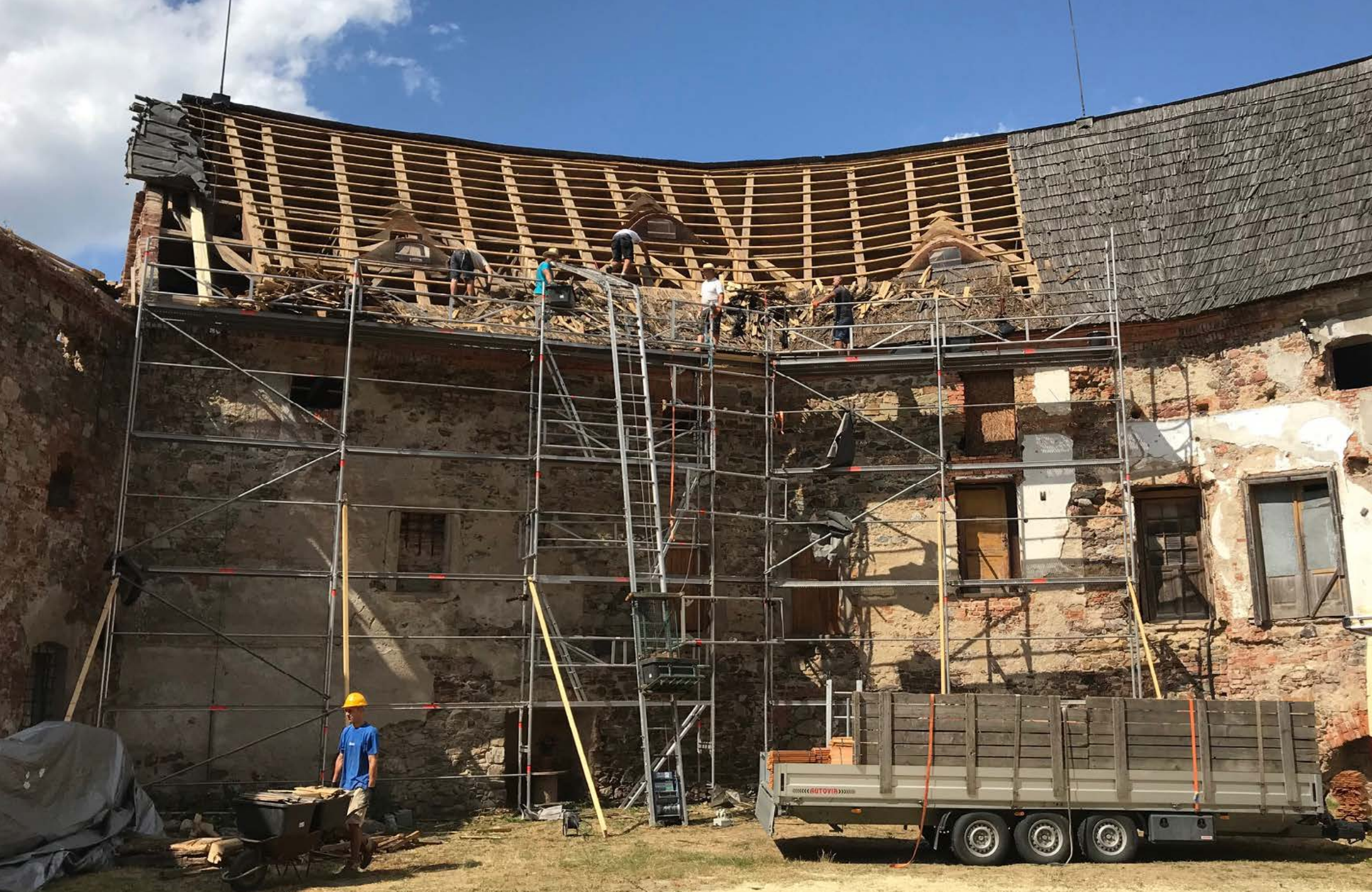
Výměna střešní krytiny na Starém paláci