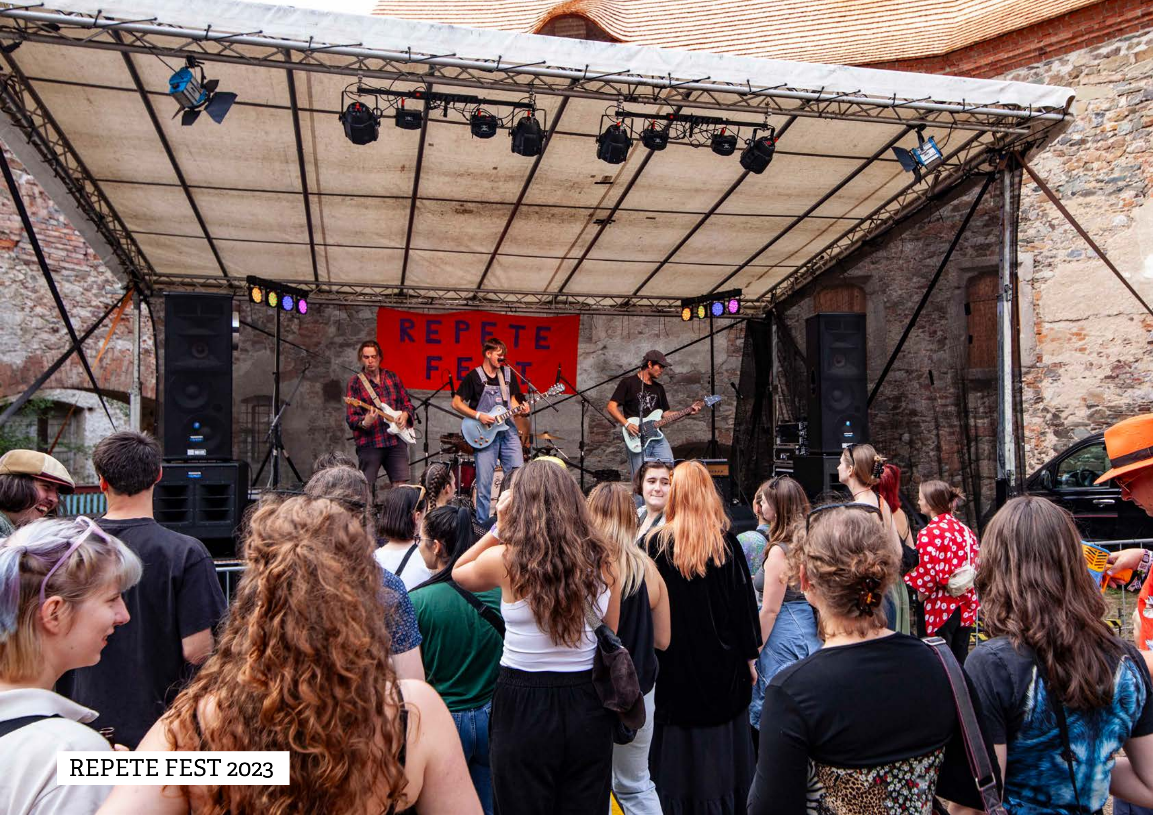
REPETE FEST 2023