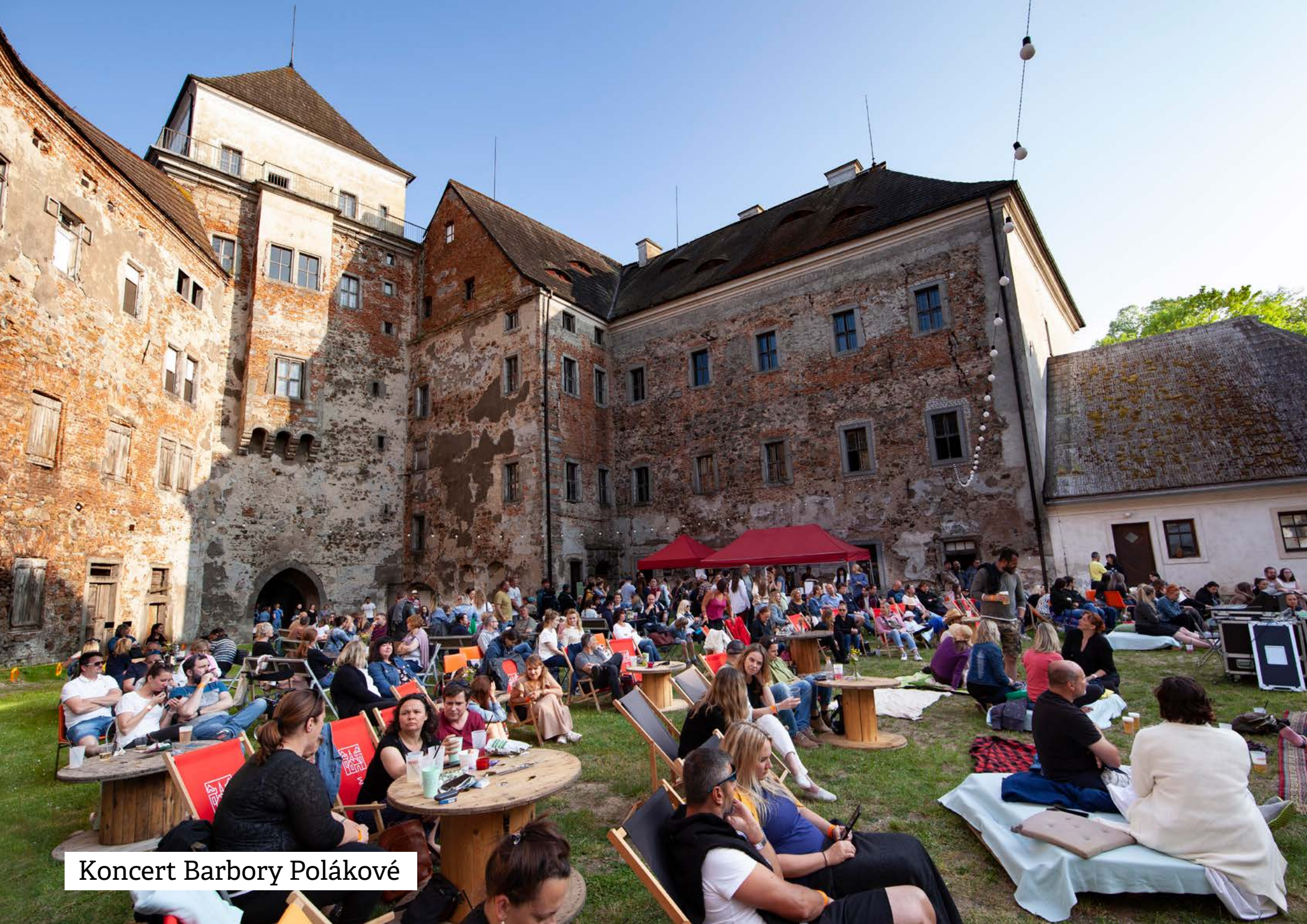
Koncert Barbory Polákové