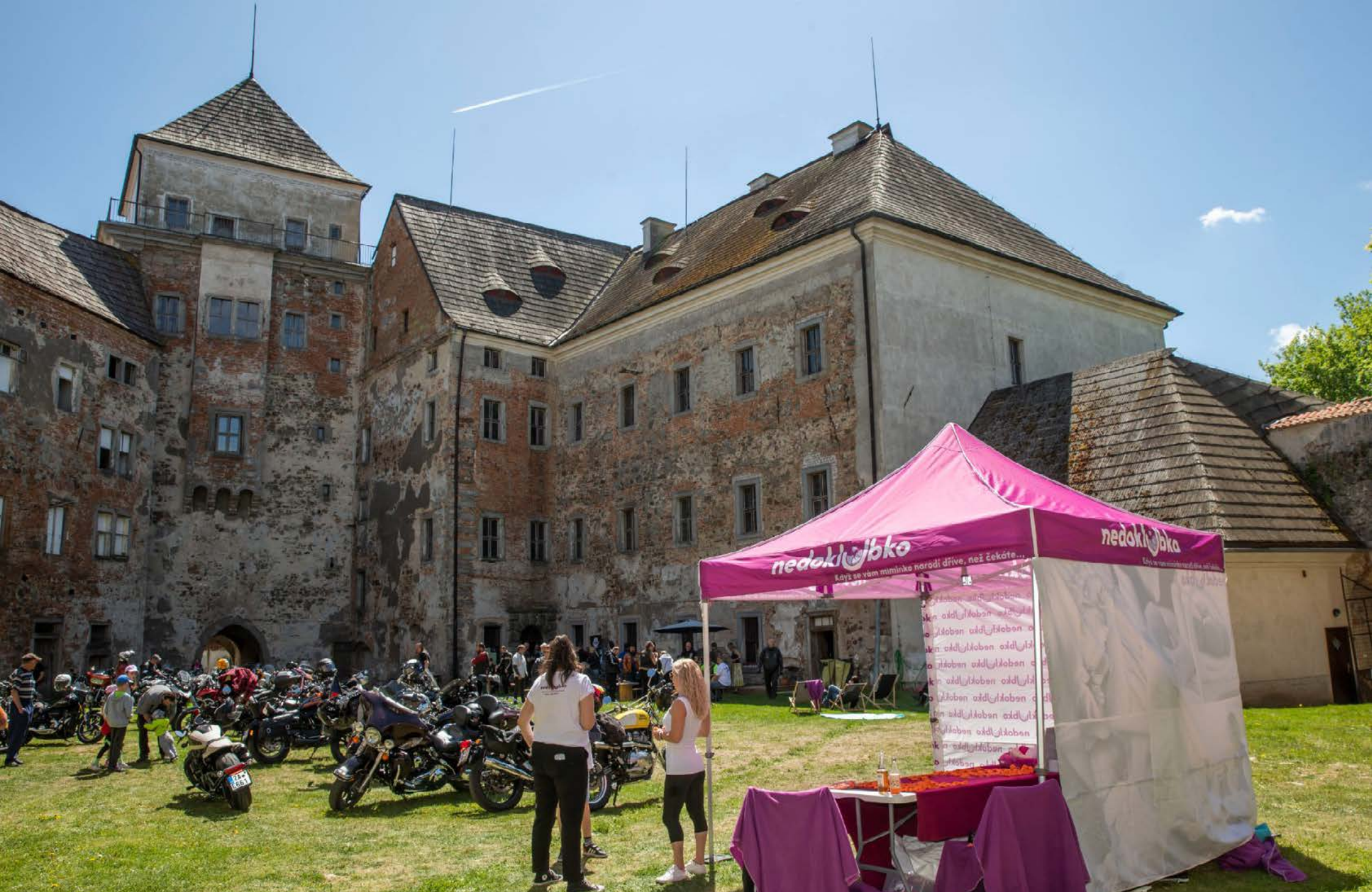
Harley Davidson Prague Challenge