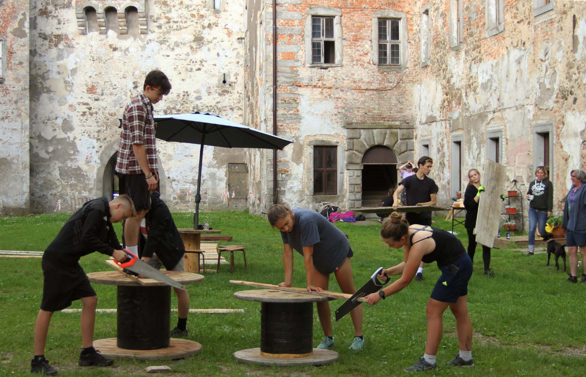
Škola da Vinci, Dolní Břežany – workshop