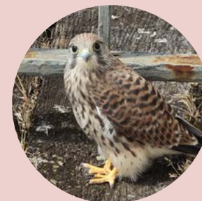
Falco tinnunculus holub regulator